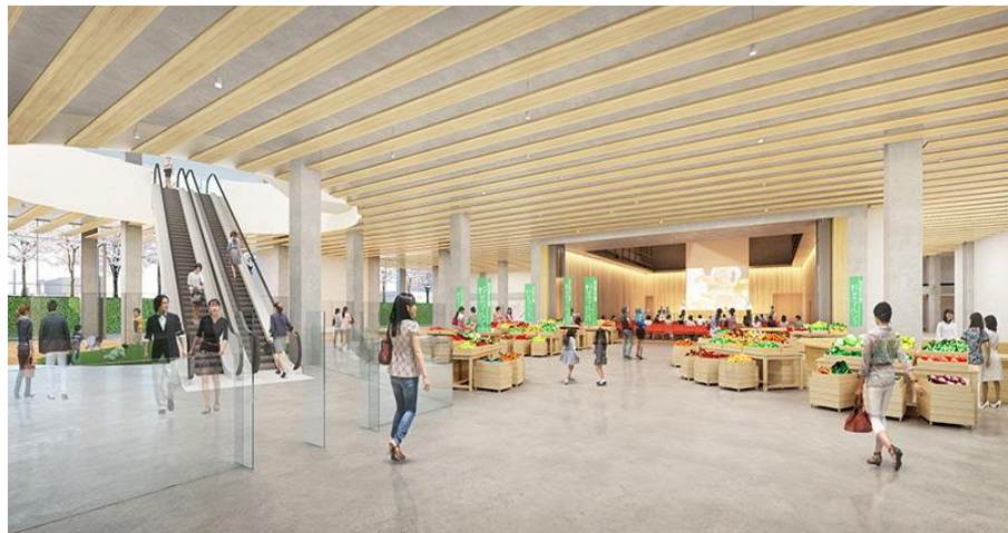
多目的ホール ▶ (オープン利用)