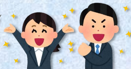
茨木市耐震プロデューサー