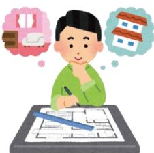
建築士・ 構造建築士