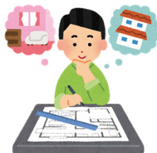
建築士・ 構造建築士