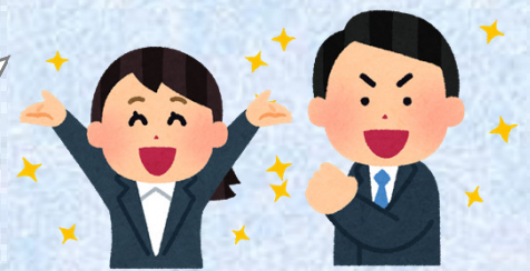
茨木市耐震プロデューサー