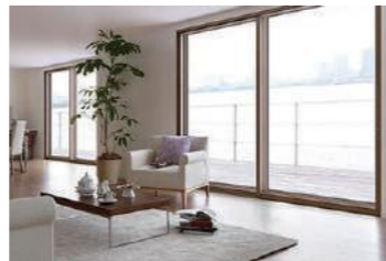
窓断熱リフォーム