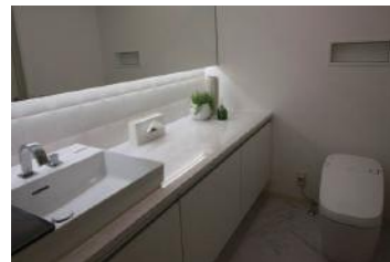
トイレリフォーム