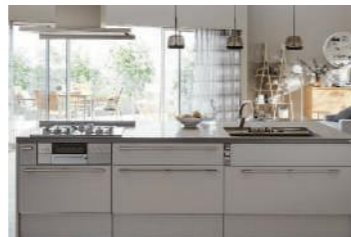
キッチンリフォーム