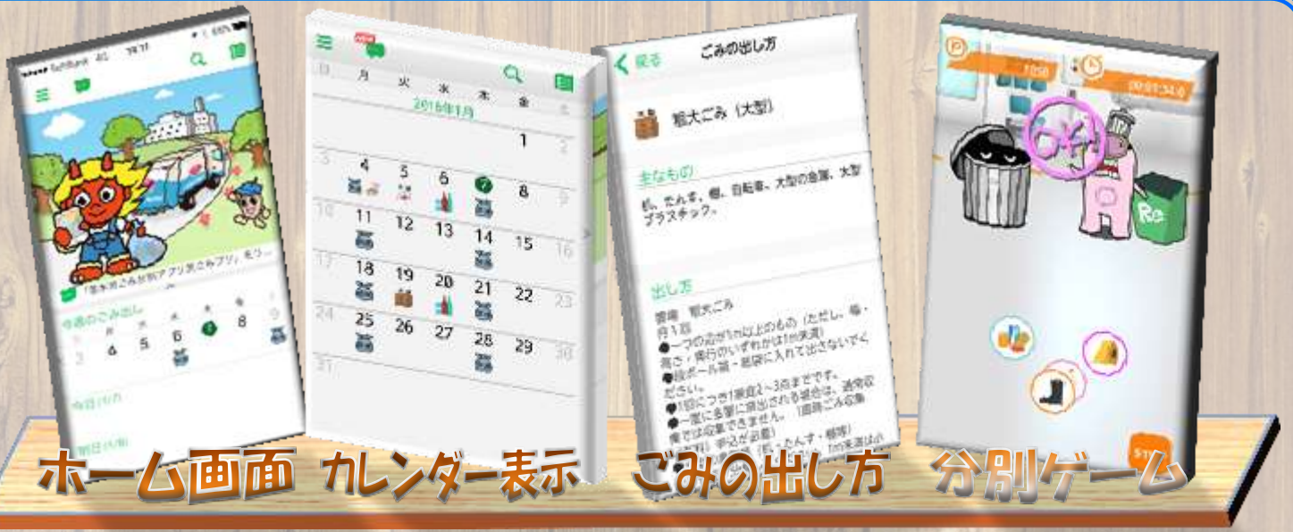
ホーム画面 カレンダー表示 ごみの出し方 分別ゲーム