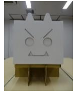
講習会で配布したダンボールコンポストです。