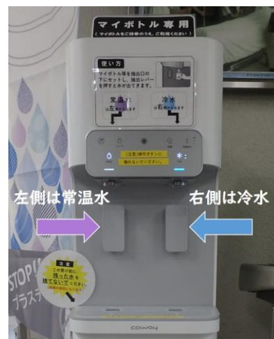
純水サーバー設置の様子