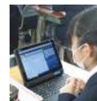
1年生:いのちの学習で

「これからの情報化社会を生き抜くために」、ICT(情報通信技術)機器を「文房具のように活用できる」ことを目的に、中学校の授業でもタブレットを使用しています。