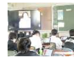
2年生:キャリア教育で