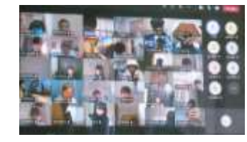
全学年:双方向通信試行

最初は、「タブレットの操作方法が難しいのでは」「壊してしまったらどうしよう」など、大人の方が不安いっぱいでした。けれど始めてみると、子どもたちはそんな心配を軽々とこえて、予想以上にスムーズに端末を使いこなしています。2学期はじめは分散登校となり、学校とご家庭の双方向通信も練習中です。心配なことは話し合っ、一つずつ解決しながら進めていく予定です。