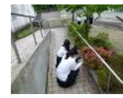
3年生:美術の時間に