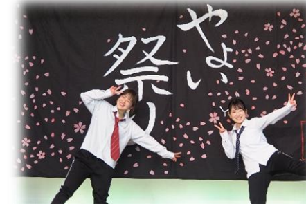
▲茨木ダンスサークル