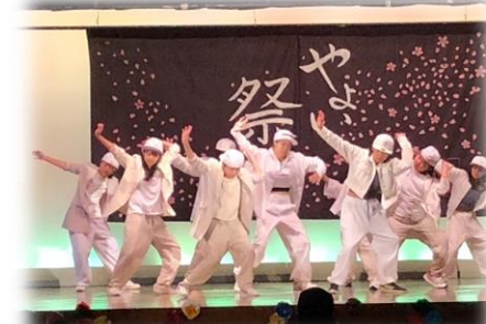
▲S☆DANCE IN THE MIND