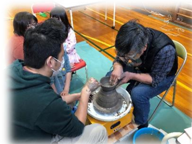
▲アトリエ信(陶芸体験)