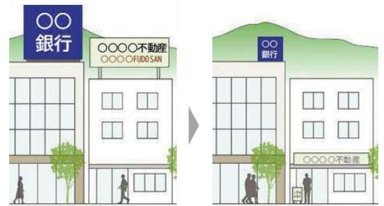
目指す広告景観のイメージ（自然との調和）