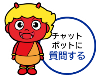
チャットボットアイコン

チャットボットのキャラクターには、茨木市の観光特任大使「いばらき童子」を採用しました。市ホームページでは、画面右下に表示された「いばらき童子」のチャットボットアイコンをクリックすることで利用することができます。