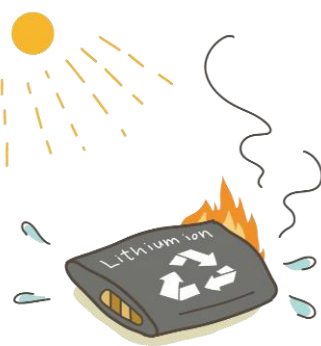
リチウムイオンバッテリー