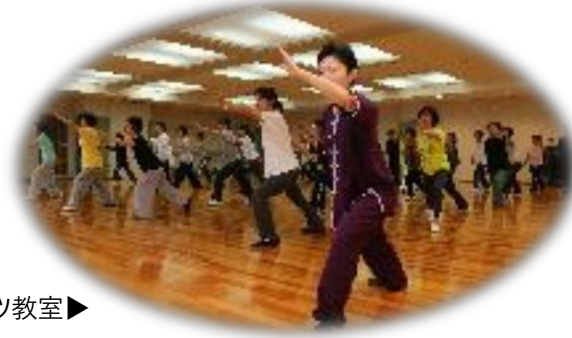
総合型スポーツクラブレッツのスポーツ教室▶