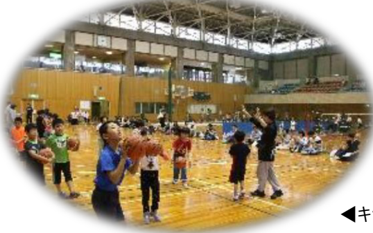
◀キッズスポーツデー