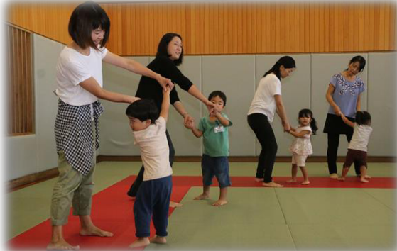
▲市民体育館スポーツ教室