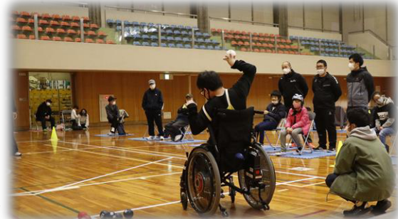
▶ボッチャ交流大会