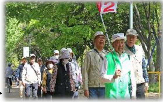
▶老人クラブ連合会「春季ハイキング」