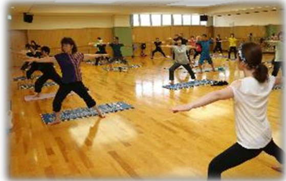
▶南市民体育館スポーツ教室