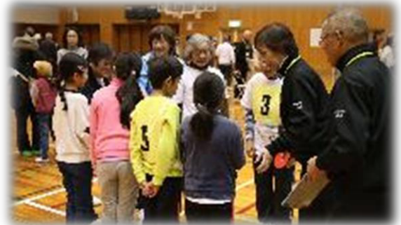
スポーツ推進委員の活動の様子▶