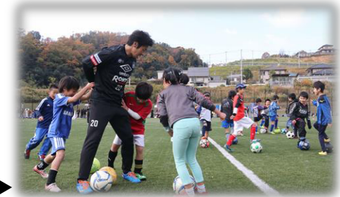
ガンバ大阪によるトップアスリートスポーツ教室▶