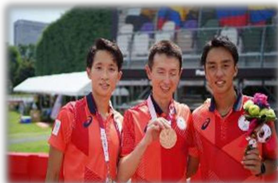
▲東京2020パラリンピックメダリスト和田伸也選手 (写真中央)