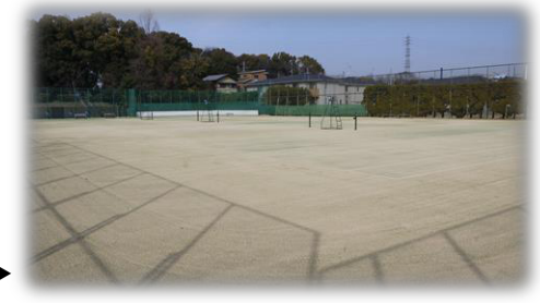
新たに整備された西河原公園南庭球場▶