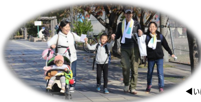
◀いばらき・de・愛・発見ウォーク