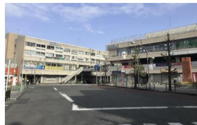
駅前ビルの老朽化・ 耐震性不足 建物が周辺地域との 空間のつながりを障害