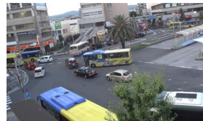
駅前広場出口での 車両錯綜