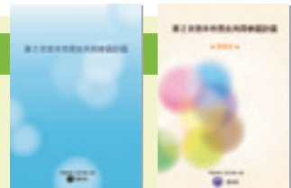
計画全文と概要版をご用意しています。

希望される方は人権・男女共生課(TEL 072-620-1640、FAX 072-620-1725)までお問い合わせください。