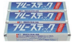
刑務所作業製品の一例

☑️1/27（土）・28（日）、①10:00～19:00・②11:00～16:00、☑️イオンモール茨木ジョイプラザ、☑️①刑務所作業製品（タンス、テーブル、枕カバー、エプロン、革靴、ベルト、バッグ、石けん、折り紙、おもちゃ等）の展示・販売、浪速少年院による活動パネル展示・販売、☑️②輪投げコーナー、☑️地域福祉課☎620・1634