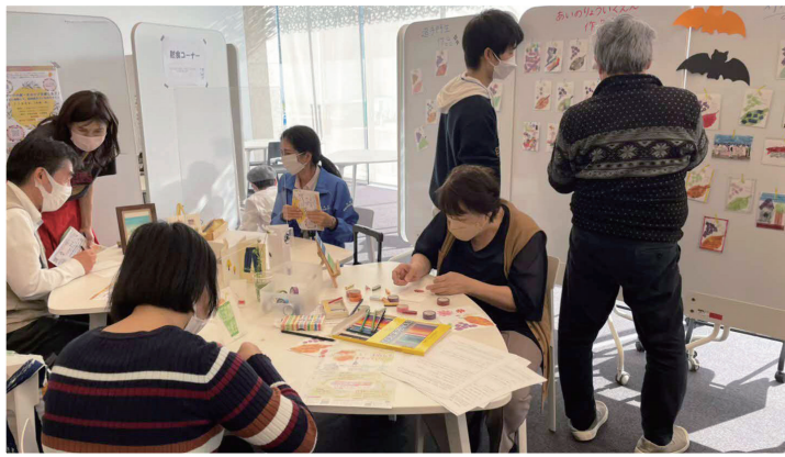
アートワークショップの様子