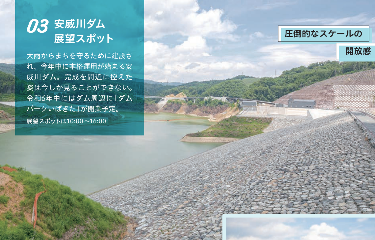
ダム湖の様子を一望できる