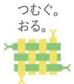
「おにクル」開館プレ事業

定員・申込などの記載がない場合は事前申込不要または当日直接会場へ。費用の記載がない場合は参加無料。