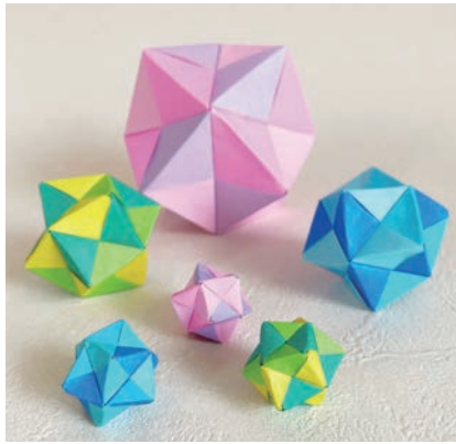
おりがみで12面体づくり

6日(木)、午前10時30分～午後0時30分、 ②8日(土)・③29日(土)、午後1時30分～ 4時、④8月3日(木)、午後1時～4 時、 所 ①OOCまちライブラバー、② 総持寺・③豊川いのち・愛・ゆめセン ター、④ローズWAM401・402、 対 外国 人または外国にルーツのある人(④は 小学生等)、 内 ①やさしい日本語で話 そう、つながろう！「絵本で世界旅行」、 ②日本の伝統行事「七夕」を楽しもう、 ③やさしい日本語で防災を学ぶ、④お