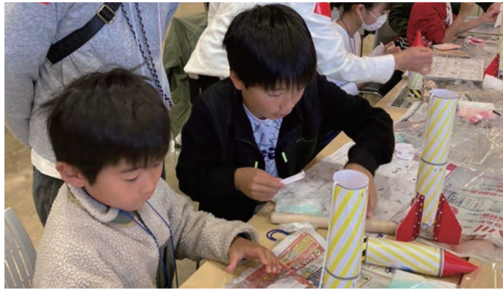
ペーパークラフトでロケットをつくる様子