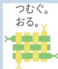
「おにクル」開館プレ事業

時 6/11(日)、10:00～12:00、 所 クリエイトセンター喫茶・食堂スペース、 内 おにクルに移転する図書館・子育て支援総合センター等の担当課からおにクル開館に向けた取組の話を聞き、おにクルで行いたい活動を考える、 申 市民活動センター HP から申込または、電話で市民活動センター ☎ 623・8820