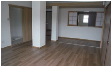
新婚・子育て世帯住宅

620・1653 接、同課☎ で配付）を、 郵送または直 ゆめセンター 各いのち・愛・ 書（建築課、 効）に、申込 15日（消印有 甲 6月1日