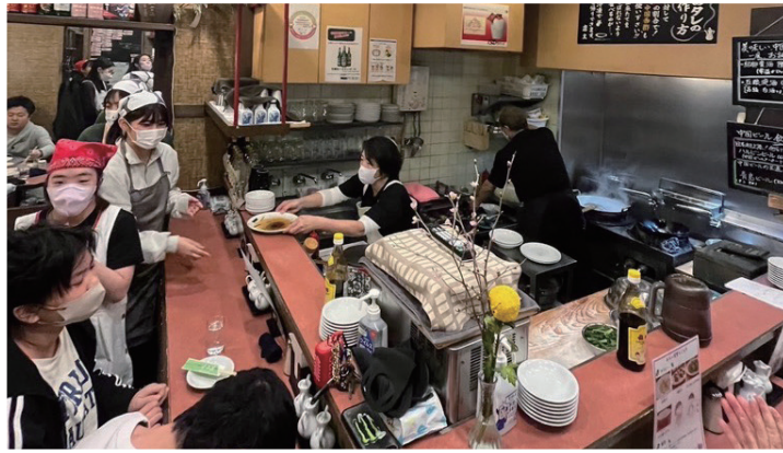
「えこんち」開催の様子