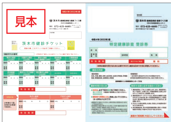
今年度市健診チケット(特定健康診査受診券を含む)

今年度の市健診チケット(特定健康診査受診券を含む)、乳がん・子宮がん検診無料クーポンの有効期限は3/31です。3月中に受診してください。なお、来年度の市健診チケットは4月中に発送する予定です。