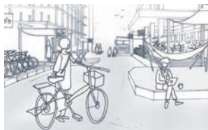
市役所前線将来イメージ

⑤ 3/25 (土)、11:00～18:00、⑥ キッチンカー、ストリートピアノ、絵本読み聞かせ、道の利活用をテーマにしたトークセッション、⑦ 同日におにクルの工事現場紹介やIBALAB@広場でのイベントを開催、⑧ 市民会館跡地活用推進課 ☎ 655・2757