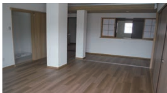
新婚・子育て世帯住宅

市営住宅入居者 対 市内在住・在勤者、その他募集区分により資格制限あり（詳細は入居申込のしおり参照）、 内 一般世帯Ⅱ道祖本住宅1戸、沢良宜住宅2戸、総持寺住宅1戸、福祉世帯Ⅱ道祖本住宅1戸、新婚・子育て世帯Ⅱ道祖本住宅1戸、 申 12月1日～15日（消印有効）に、申込書（12月1日から建築課、各いのち・愛・ゆめセンターで配布）を郵送または直接、〒567-18505 同課 ☎ 620・1656