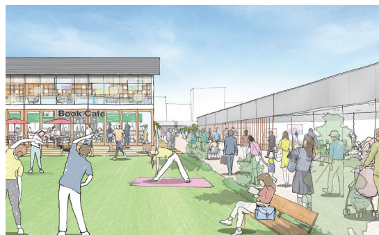
参加者のアイデアを重ね合わせた駅前のイメージ図