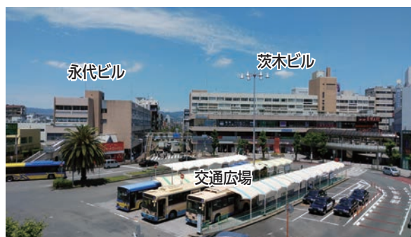
阪急茨木市駅西口駅前周辺