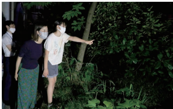
5月27日・28日 | 暗闇に飛び交う「水尾のホタル」 水尾小学校でホタルの鑑賞会

市民体育館等でキッズスポーツデーを開催し、5歳から小学6年生の子どもたちがサッカーやバスケットボール、バドミントンなどさまざまなスポーツを体験しました。バスケットボールに参加した児童は「初めて体験したので緊張したけど、やってみてすごく楽しかった」と話しました。