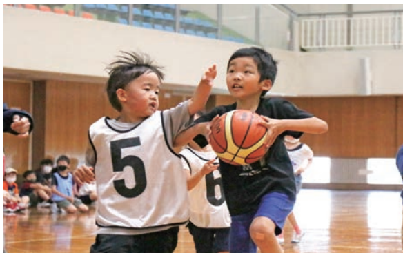
5月29日 | 自分に合ったスポーツを見つける キッズスポーツデーを開催

市民体育館等でキッズスポーツデーを開催し、5歳から小学6年生の子どもたちがサッカーやバスケットボール、バドミントンなどさまざまなスポーツを体験しました。バスケットボールに参加した児童は「初めて体験したので緊張したけど、やってみてすごく楽しかった」と話しました。