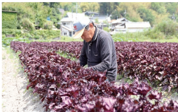
6月上旬～7月上旬 | 茨木の特産品として親しまれる 「赤しそ」が収穫期を迎える

生涯学習センターで、現代美術—茨木 2022 展「メタコンセプトチュアル」が開催されました。出品者相互の交流と現代美術の発展を目的に、昭和43年から続く本展覧会。訪れた市民は「考えもつかないような発想をしている作品が多くあって、とても勉強になりました」と興味津々な様子でした。