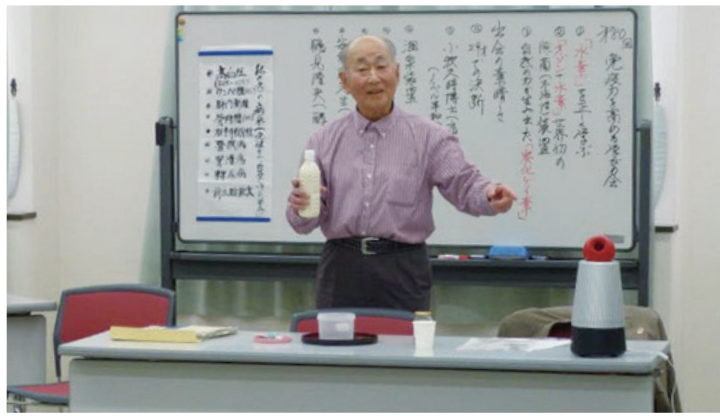
免疫力を高める学びの会の様子