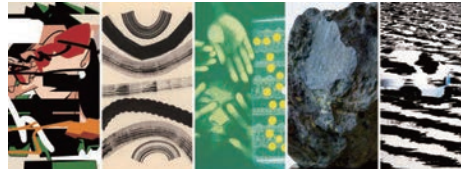
左から左記作家と同順（作品は一部分）