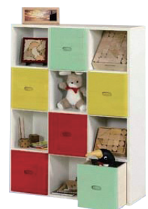
展示・販売品の一例