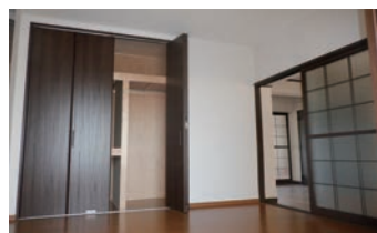
道祖本住宅(新婚・子育て)