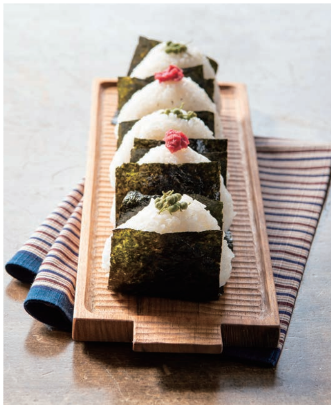
青実山椒佃煮(小倉屋松柏)、味付け海苔(海苔のひさご)