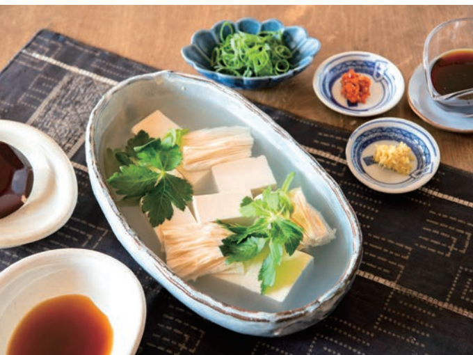
生とうふ 絹と手造り湯葉(伏見屋)