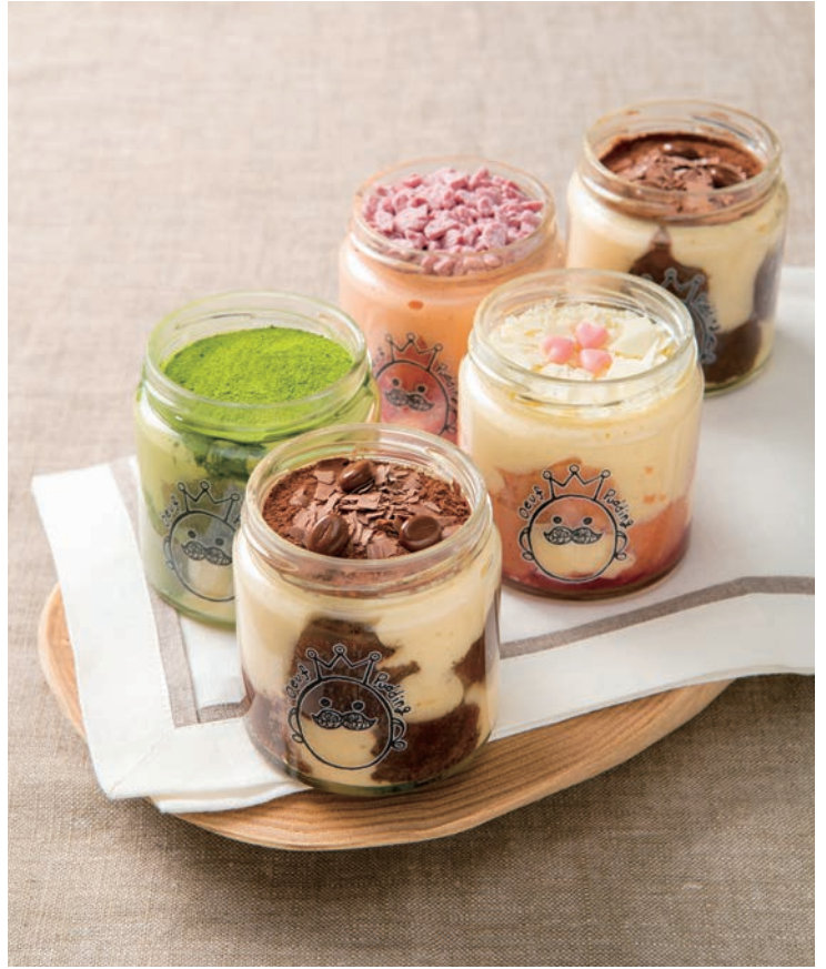
プリンとティラミスを組み合わせた「ティラプリ®」が一番人気(写真手前)