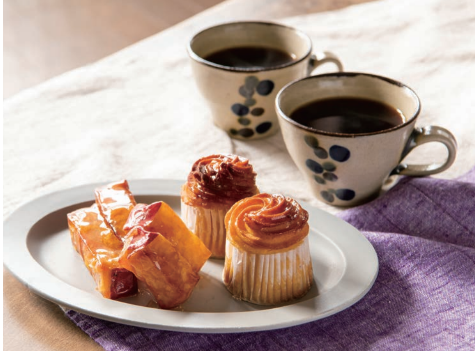
スイートポテトと大学芋(氷とお芋の専門店らんらん)、ドリップパックコーヒー(珈琲豆焙煎所マウンテン)

ふるさと納税返礼品に登録されている地元グルメは、ちょっとした手みやげにもぴったり。大切な人へのお歳暮などにも。