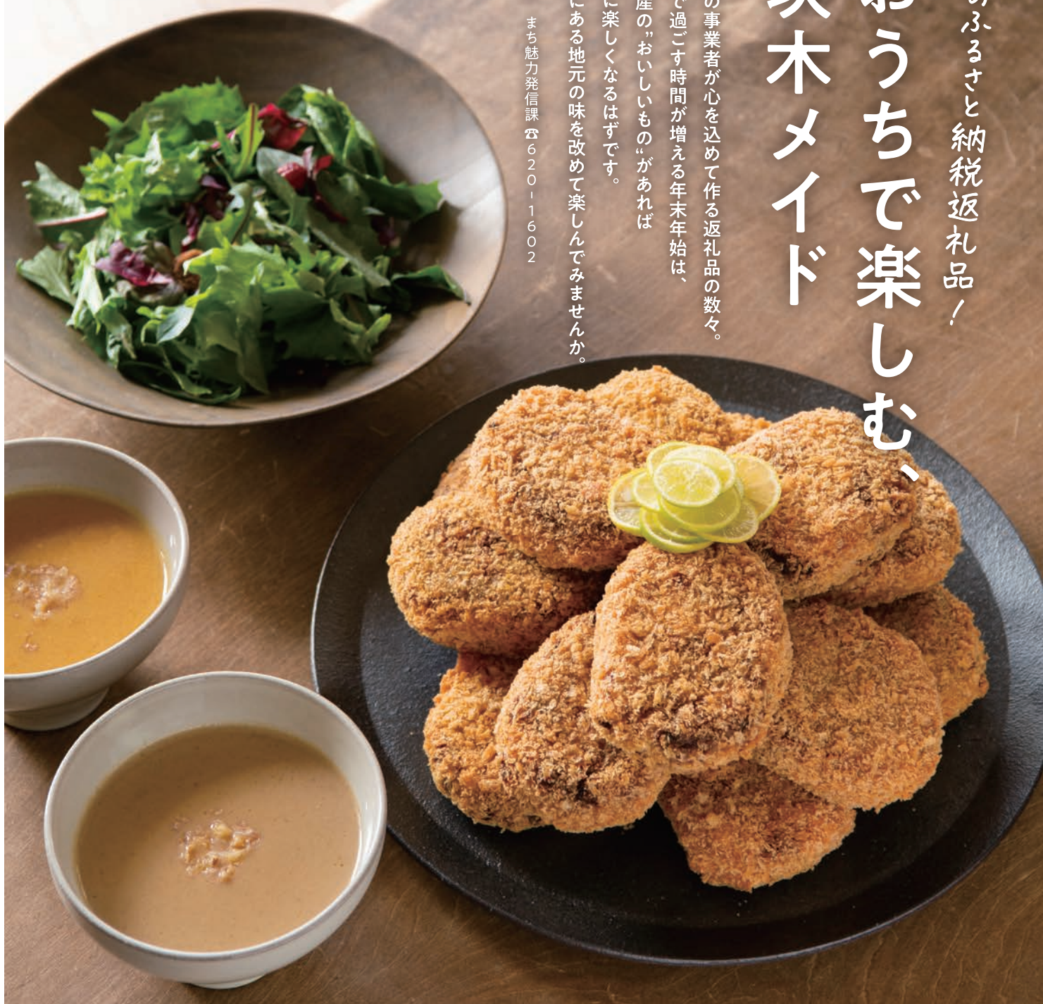
牛すじゴロゴロカレーコロケ(割烹片桐)、こだわり素材の味噌ポタージュスープ(素直な力)