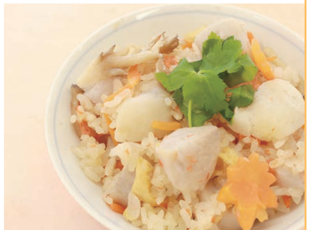
里芋の炊き込みごはん