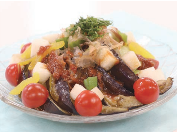
夏を彩る梅ポン酢サラダ

暑い日が続くと食欲が落ちて、身体もだるくて疲れが取れない……。そんな時におすすめなのが梅です。梅に含まれるクエン酸は、疲労回復や血液をサラサラにするなど、うれしい効果がいっぱい！ビタミン豊富な夏野菜と一緒に食べることで夏バテ防止にもなります。