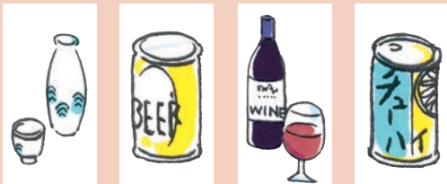
日本酒 1合 180ml ビール 500ml ワイン 200ml 7%の燃料 350ml