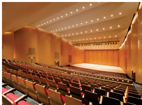
立命館いばらきフューチャープラザ グランドホール

市の行事等に利用するため、次の日の施設利用はご遠慮ください。なお、福祉文化会館・クリエイトセンターの6月抽選分の申込受付は5月20日~31日に行います。 「クリエイトセンター」センターホール 来年6月6日・11日~13日・18日~20日 終日 、 多目的ホール 12月9日・23日 午前 9時~午後5時、12月20日・28日~31日 終日 、 「生涯学習センター」(火曜日休み) きらめきホール 11月1