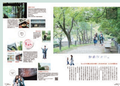
市民モデル登場例（令和元年 12 月号）

☑市内在住・在勤・在学者、☑都合により掲載できない場合があります。☎申込書（まち魅力発信課で配付、市 HP からダウンロード可）と登録者の写真（L 版）を直接、同課 ☎ 620・1602