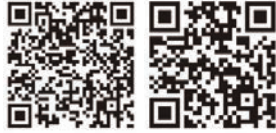
LINE Pay モバイルレジ

●コンビニ収納用バーコードがない納付書や納付期限が過ぎた納付書は利用できません。要件等詳細は市HPをご覧ください。●収納課 ☎ 620・1616