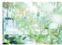
商店街は老舗のうどんやたこ焼き、スイーツなど、つい立ち寄りたくなる店も多い