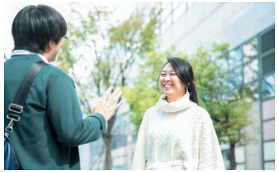
2人の週末は阪急茨木市駅からスタート。阪急・JRの駅周辺は お散歩デートにぴったり