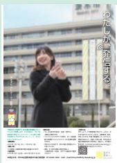
市民モデル登壇例