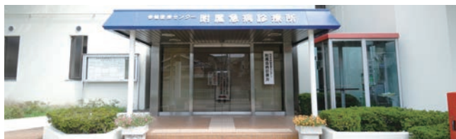
保健医療センター附属急病診療所

※ 12/29～来年 1/3 は日曜日・祝日の受付時間と同じ。土・日曜日、祝日の 23:30 以降は来所する前に ☎ 625・7799 へ連絡してください。