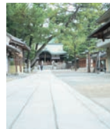
ちょっと脇に入れば、店主のセンスが光る個性豊かなお店に出合える