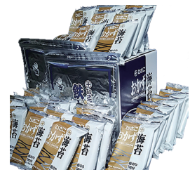
今年度の返礼品の例