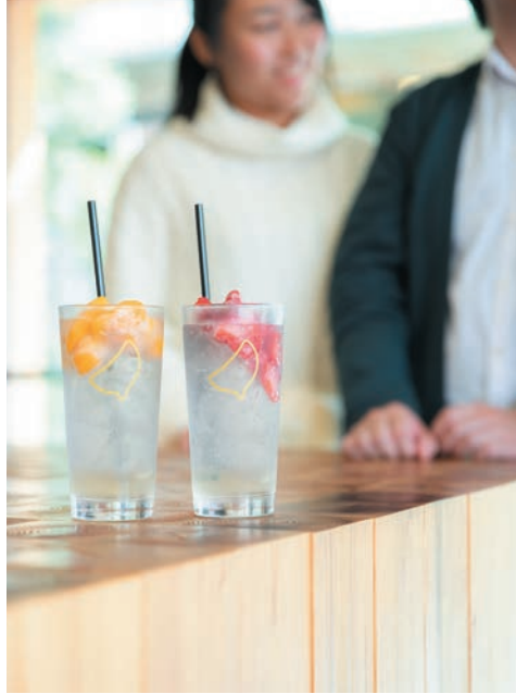
スタンディングスタイルのバル など、気になる新店が増加中