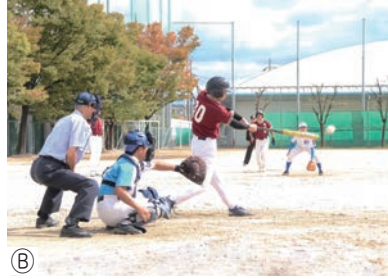
Ⓐ教育文化月間表彰式（11/3）、Ⓔ公民館区対抗ソフトボール大会（10/6・20）、 ㉑茶華道展（11/9・10）、Ⓕ相馬芳枝科学賞（11/9・10）、Ⓖ邦楽名演会（10/13）