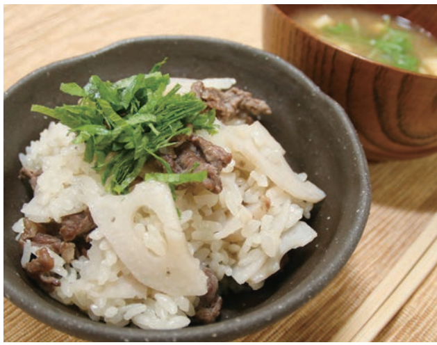
れんこんの炊き込みごはん