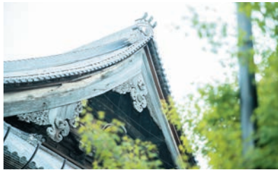
東本願寺茨木別院