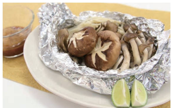
きのこのホイル焼き

秋といえばきのこがおいしい季節です。食用きのこ類に含まれる豊富なビタミンや食物繊維は、免疫力の向上、血糖値の改善作用などの効果があり、便秘にも良いとされています。一品料理としてはもちろん、肉や魚料理に添えて、食欲の秋においしくきのこを食べましょう。