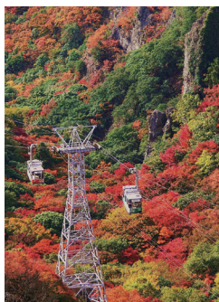
小豆島町の寒霞渓

姉妹都市・小豆島町と歴史文化姉妹都市・竹田市との交流促進を図るため、指定宿泊施設を利用する市民に、宿泊費用の一部を補助しています。