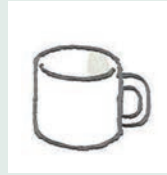
プラスチックの食器