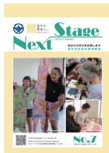
Next Stage No.7

定3枠(縦6cm×横18cm・フルカラー・冊子裏表紙)、¥1枠3万円、備市内事業者優先、12月1日に4300部発行、市内各所に配布予定、☎9月25日までに、申込書(市HPからダウンロード可)と広告見本・市税完納証明書(申込日前3か月以内の証明日)を直接、生涯学習センター窓 ☎624・8182