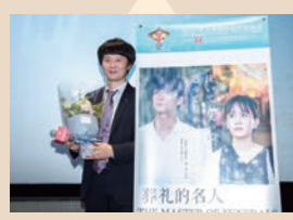
上海国際映画祭の様子

さて、この度『葬式の名人』は、上海国際映画祭に正式招待され、また世界11か国から優れた映画を上映する「2019国際影視展」のクロージング上映にも選ばれました。上海での上映は毎回満席で、上映後は大きな拍手が沸き起こりました。皆さんのおかげで茨木の映画が世界に羽ばたいたのです!