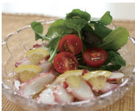
タコのカルパッチョ風

食欲が落ちやすくなる蒸し暑い夏には、加熱いらずのひんやり冷たい料理がオススメ。ガラスの器に盛り付けるとより涼しげで、見た目も味わいも爽やかな一品になります。今が旬のタコは、疲労回復に効果のあるタウリンを多く含んでいて夏バテ予防に最適です。