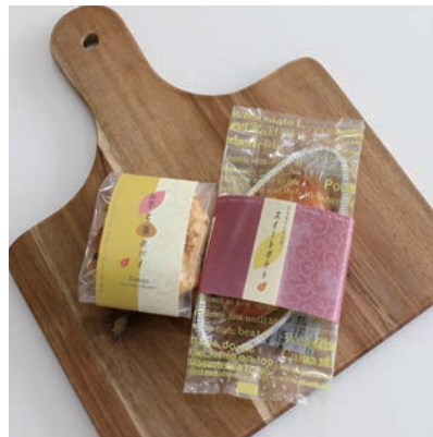
昨年のおいもスイーツ

書(商工労政課で配付、市HPからダウンロード可)を、ファックスまたはメールで、同課 ☎620・16200、 FA X 627・0289、✉syokorosei@city.ibaraki.g.jp