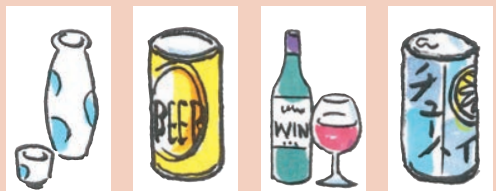
日本酒 1合 180ml ビール 500ml ワイン 200ml 7%のフェール 350ml