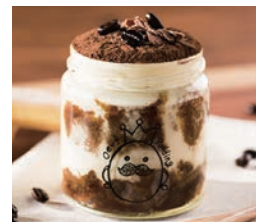
写真は昨年度返礼品の一例

募集する返礼品 市内で生産、製造、加工またはサービス提供しているもの等、詳細は市HPの募集要項参照 対象 本社、支社、事業所、工場のいずれかが市内にあり、上記の返礼品を提供できる法人または個人事業者 申込 申込書(市HPからダウンロード)と必要書類を直接、まち魅力発信課 ☎ 620・1602