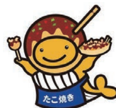
たこ焼きクーちゃん

【時】【発売期間】7月2日(火)～8月2日(金)、【抽せん日】8月14日(水)、【問】(公財) 府市町村振興協会 ☎06・6941・7441