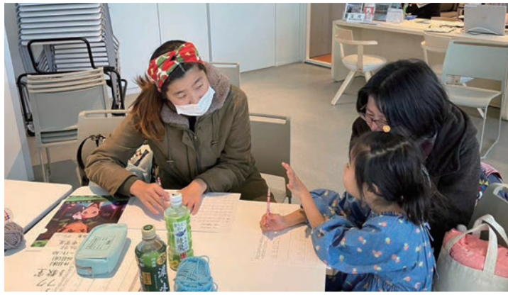
子どもに英語を教えている様子