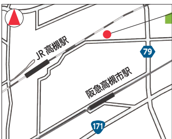
高槻島本夜間休日応急診療所

※日曜日・祝日の 9:30～16:30 (12:00～13:30 を除く) は、内科・小児科の診察時に医師の判断で季節性インフルエンザ・新型コロナの抗原検査を実施しています。※診療開始時間は受付開始の 30 分後からです。※詳細は市 HP 参照。