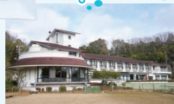
レストランの営業時間は11:00～14:00。 ※27ページでお部屋でのんびり昼食プランを紹介

こどもも大人も楽しめる！ 忍頂寺スポーツ公園 へ 山の斜面を利用した遊具が揃う「わんぱく広場」は、こども達が笑顔になる遊び場。角度のついた大きなすべり台や全長70mのローラーライダーに胸が躍ります。遊んだ後は「竜王山荘」のレストランで食事を楽しむこともできます。予約をすれば大浴場や宿泊室の利用も可能です。