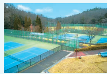
①左・上) アトラクションのように楽しめる遊具の数々。 下) テニスコートは6面完備。利用には電話予約が必要。