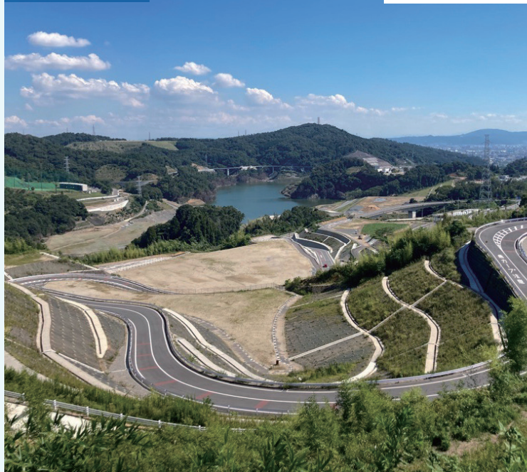
※交通ルールを守って安全には十分に注意して走行してください。