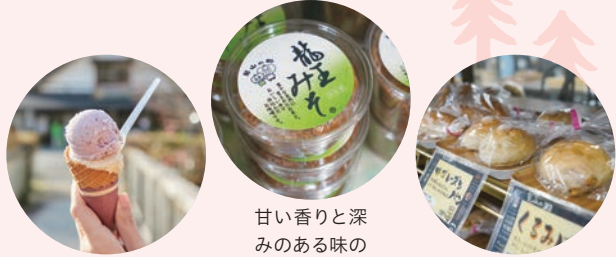
選べる味も豊富なジェラート