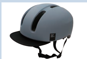
【参考】自転車用ヘルメット