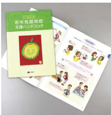
府発行の若年性認知症支援ハンドブック

答 講座については、新規サポーターの養成だけでなく、さらに地域で活動していただけるよう、過去に受講したサポーターへのフォローアップ研修等も実施していく。また、若年性認知症については、支援ハンドブックの配布など、周知に努めているが、若年性認知症の方が、適切な障害福祉サービスなどにつながるよう、きめ細やかな支援に努めていく。