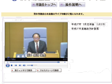
市議会インターネット中継の画面

本会議(定例会、臨時会)のライブ中継及び録画配信をインターネットで視聴いただけるとともに、市役所本館1階ロビーでもライブ中継をご覧いただけます。 ( http://www.city.ibaraki.osaka.jp/shisei/gikai/ )