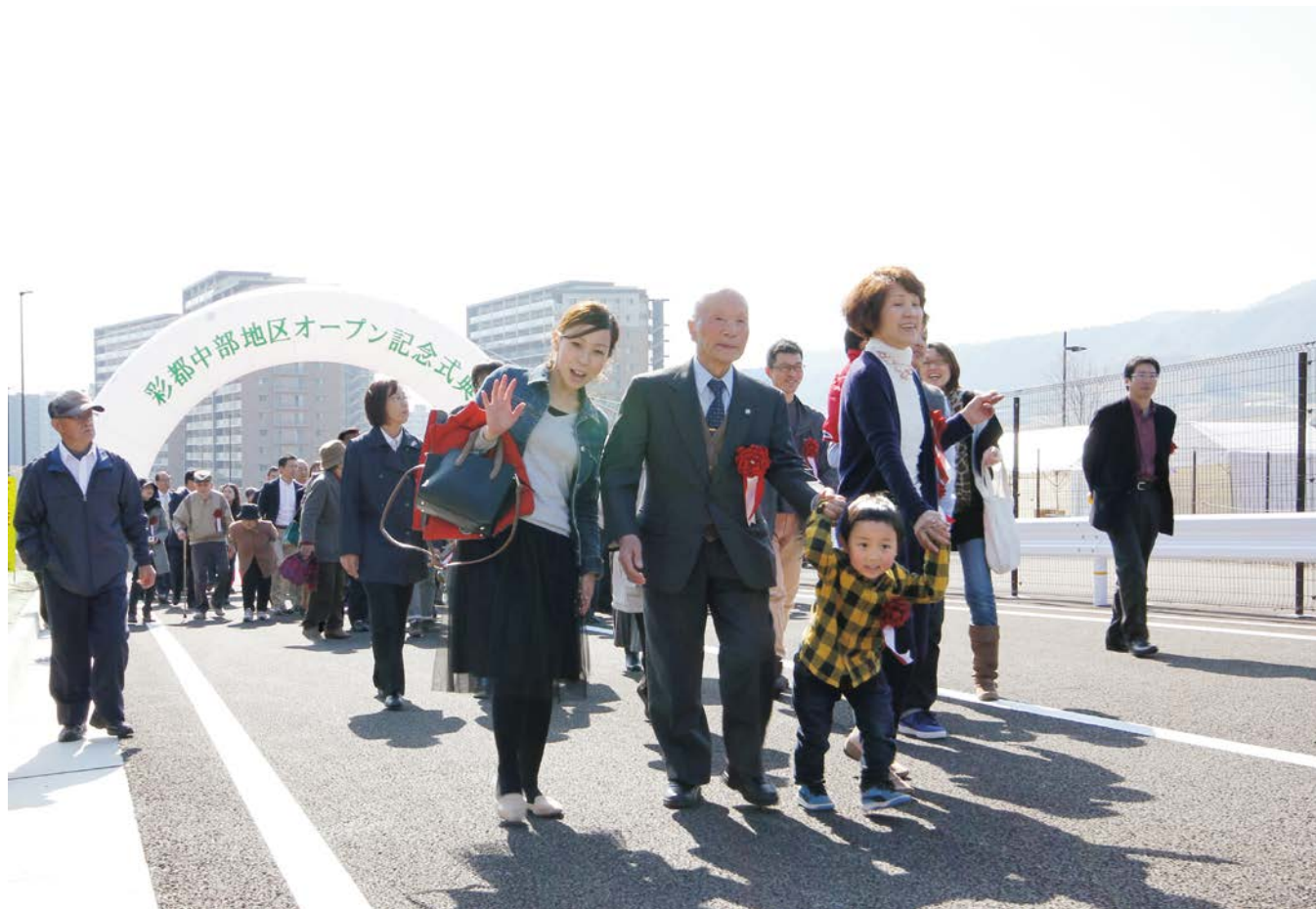
3月27日に開通した彩都中部地区アクセス道路の渡り初めをする参加者（彩都中部地区オープン記念式典）