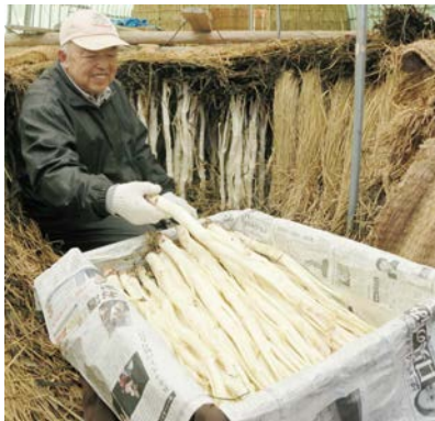
千提寺地区での三島うづくり

答 三島つばは、数年前まで太田地区や千提寺地区の数軒で栽培されていたと聞いているが、現在は千提寺地区の1軒のみとなっている。なにわの伝統野菜にも指定されている三島つばの生産を絶やさないことを願っていたところ、新たな担い手が見つかったので、栽培が軌道に乗るよう支援していく。