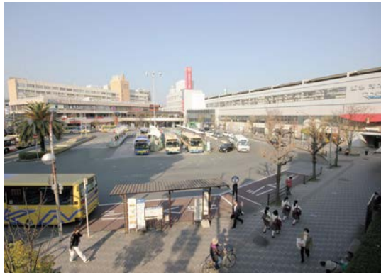
阪急茨木市駅西口付近

答 駅周辺再整備における、西口と東口の関係については、駅周辺の機能強化を図るために、東西の有機的な連携が必要と考えている。そのため、事業として実施する範囲など、さまざまな要素を踏まえ、全体として大きな方向性を示しながら、それに基づき、各事業を進めていくことが適切と考えている。