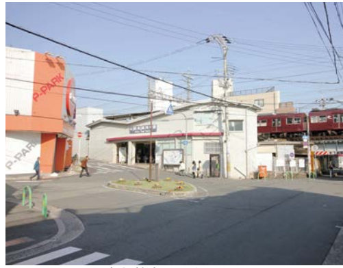
阪急総持寺駅西改札口付近

効果をいかし、新たな賑わいや活力の創出につなげていくとともに、商業が集積する東側地域の整備に発展させる必要があると考えている。