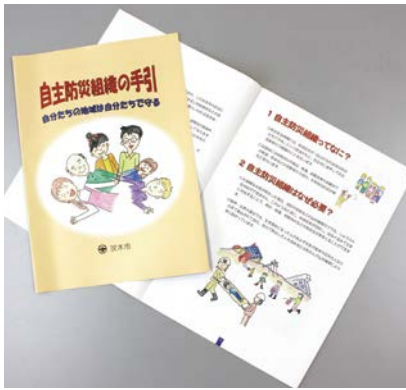
市発行の自主防災組織の手引

答 自主防災活動については、市広報誌や防災ハンドブック、出前講座などを利用し、その重要性を啓発するとともに、平成27年度は各地域の