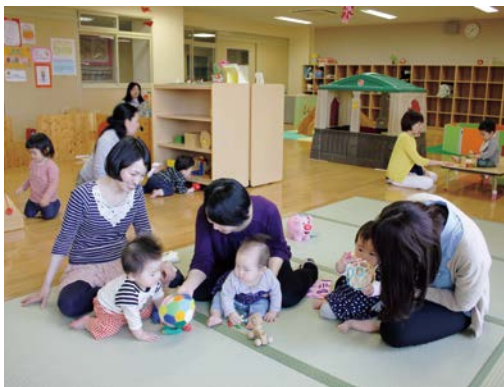
ぽっぽルームで遊ぶ親子(東中条町)

答 つどいの広場は、仲間づくりの促進や子育て情報の発信に加え、スタッフが保護者の気持ちを受け止めることで、子育て中の孤立感などを解消させる役割があると考えている。また、つどいの広場等に対して、