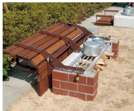
西河原公園のかまどベンチ（城の前町）

いては、平成27年度実施予定の市内全域防災訓練時に、被災者台帳の入力や被災証明発行訓練での活用を検討している。