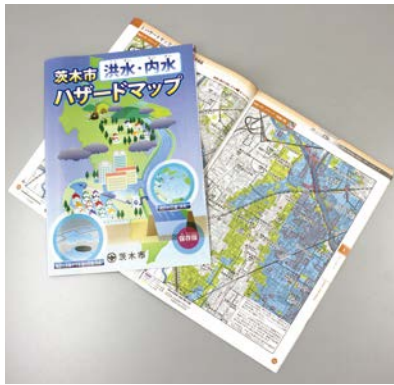
市発行の洪水・内水ハザードマップ

答 本市では、内水被害、河川氾濫、山間部の土砂災害への対策が特に重要であると認識している。その対策として、本市においては、内水対策として、下水道施設等のハード整備を推進するとともに、府による河川整備計画の推進や土砂災害防止施設等の整備による対策とあわせて、総合的な雨水対策を進めていく。