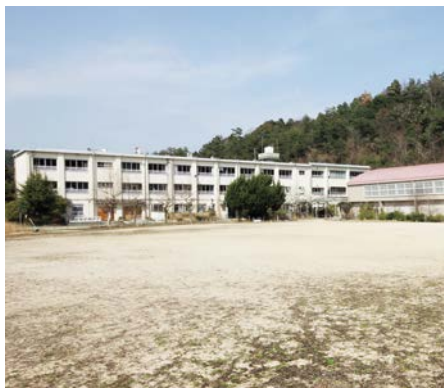
市立北辰中学校跡地(大字泉原)

北部山間地域は高齢化や過疎化が進み、地域の活力にも影響が出てきていることから、地域資源を活かし「農・林・食」をコンセプトに、地域振興に寄与する基本構想案を策定した。概算工事費は、約9億5千万円を見込んでいる。今後、里山センター