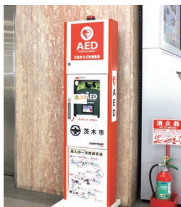
市役所本館東玄関に設置しているAED

が装着されておらず使用できなかったことがあったが、管理体制はどのようなになっていたのか。また、今回は最悪の事態を免れたが、救えるはずの命が救えなかったということがないよう、今後、どのような対策を考えているのか。