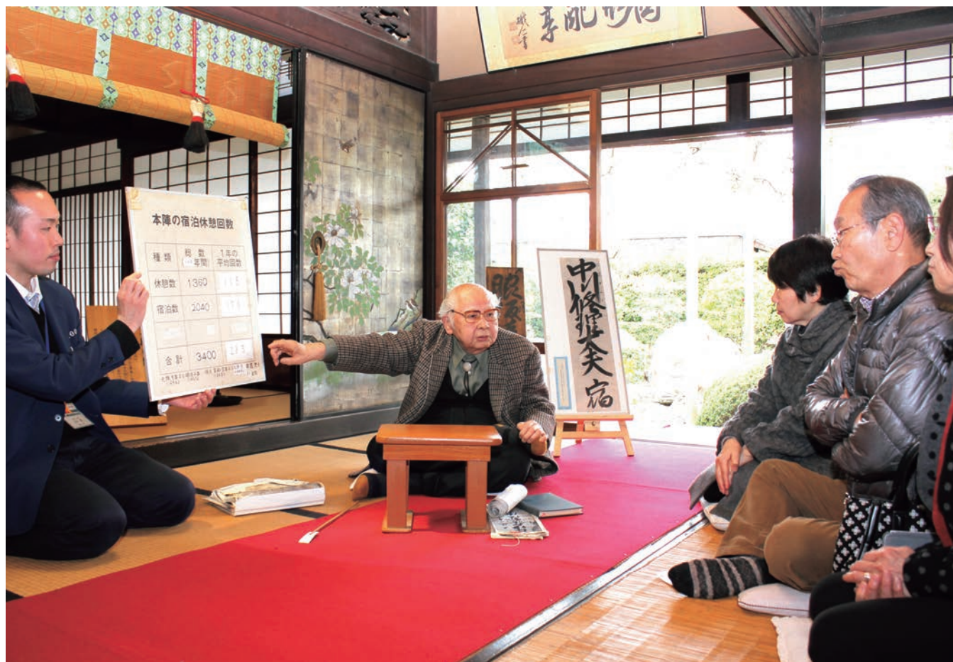
国史跡・郡山宿本陣「春の特別公開」にて、第17代当主から説明を受ける見学者（宿川原町）