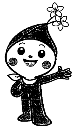
板橋区観光キャラクター りんりんちゃん